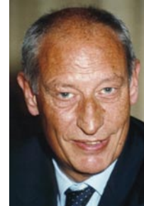
Klaus Laepple Präsident des Bundes- verbandes der Deutschen Tourismuswirtschaft