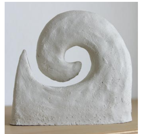
Diese Skulptur entstand in der Kunsttherapie und war Vorlage für unser Vereinslogo.

Förderung und Anerkennung des Ehrenamtes. Mit der Ausrichtung dieses Tages dankte Schramma allen Ehrenamtlichen ganz besonders für ihr vielfältiges Engagement in Köln und für die Menschen dieser Stadt.