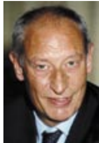
Klaus Laepple Präsident des Bundesverbandes der Deutschen Tourismuswirtschaft