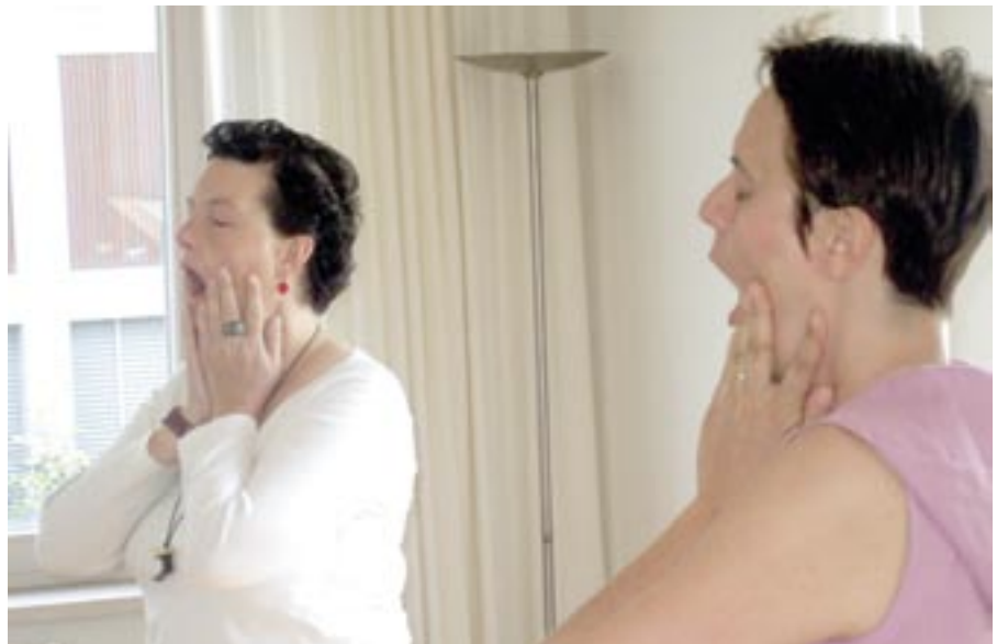
Resonanzräume und Artikulationsorgane entdecken die Teilnehmer bei den Stimmübungen.