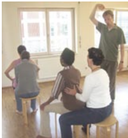
In den Rücken singen gehört auch dazu.

Ein Kernelement der Musiktherapie besteht aus dem Eingehen auf Rhythmus. Beispiel depressive Stimmungen: Musik kann motivieren, uns aus körperlicher Niedergeschlagenheit wieder aufrichten: „Händels Feuerwerksmusik vermittelt Erhabenheit, Größe und Würde. Zur Musik schreiten wir wie ein König durch den Raum.“ Ist die Musik klar strukturiert, gravitatisch, rhythmisch prägnant, lernt der Krebspatient, seiner Bewegung Kontur und Haltung zu verleihen. Raumgreifende, exakte Bewegungen – erhaben, würdevoll, klar, aufgerichtet – verkörpern Souveränität. „Eine wiedererlangte Entschiedenheit, eine auf ein Ziel gerichtete Bewegung drängen unklare, verwaschene, weiche Bewegungen zurück.“