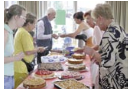
Die „Kuchenfrauen“ des Patientencafés steuerten 500 Euro aus ihrer Kaffeekasse zur Unterstützung des Vereins bei. Vielen Dank!!